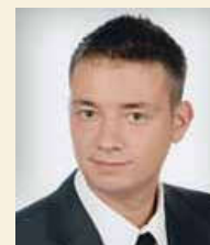
Opracowanie Artur Pierścionek

Opisane w artykule realizacje stanowią jedną z licznych modernizacji przeprowadzonych przez dział Systemów Automatyki. Nasi inżynierowie na co dzień modernizują maszyny i linie produkcyjne, projektują i programują stanowiska badawczo-testujące, czy wreszcie budują prototypowe maszyny pakujące, nawijające itp. Zakres prac jest bardzo zróżnicowany zaczynając od prostych układów automatyki, po złożone systemy automatyzujące całe procesy technologiczne.